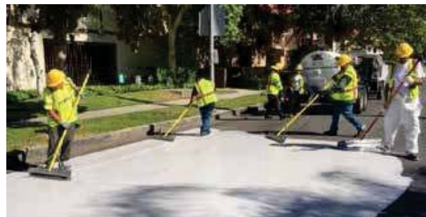
الف) ایالات متحده آمریکا