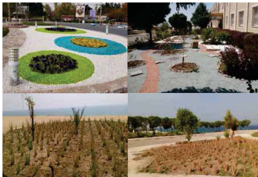
شکل (۳): نمونه تجربیات سازگاری با کم‌آبی در فضای سبز ارائه شده در رویداد ملی سازگاری با کم‌آبی (تیر ۱۳۹۸)

• استفاده از ضایعات هرس درختان به‌عنوان مالچ چوب و استفاده از مالچ گیاهی برای کاهش تبخیر آب آبیاری و نفوذ بهتر آب